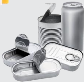
Dosen aus Metall oder Aluminium