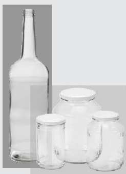
Glas bis \varnothing 70 mm